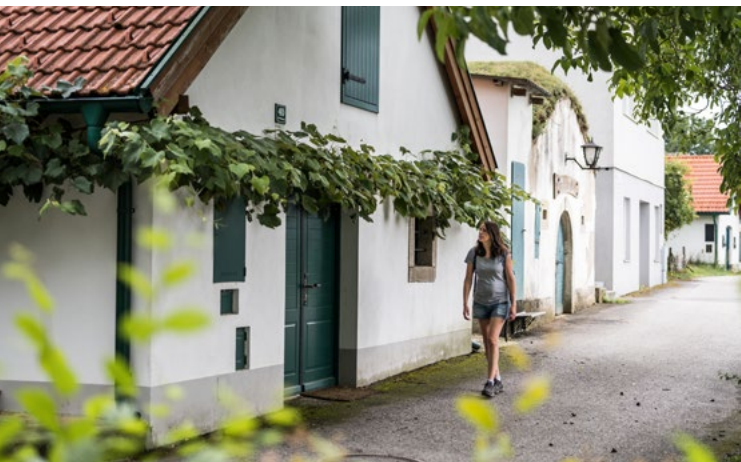
VIA.CARNUNTUM, ©Andreas Hofer

3 Routen stehen zur Auswahl: Rundweg Göttlesbrunn-Arbesthal, Rundweg Höflein und Rundweg Stixneusiedl.