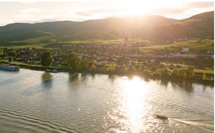
Weißkirchen in der Wachau

Unbedingt kosten: Riesling, Grüner Veltliner, Neuburger und Gelber Muskateller