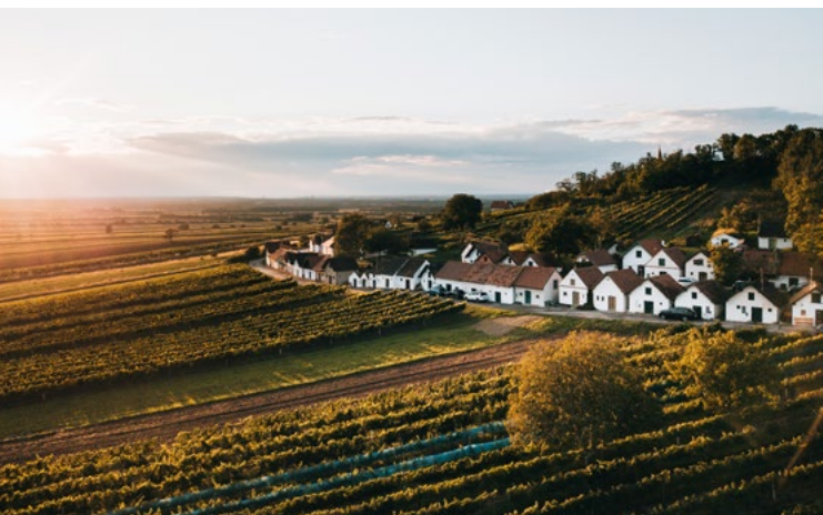
Kellergrasse Galgenberg