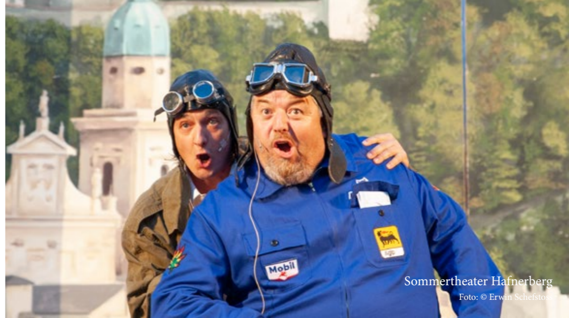
Sommertheater Hafnerberg