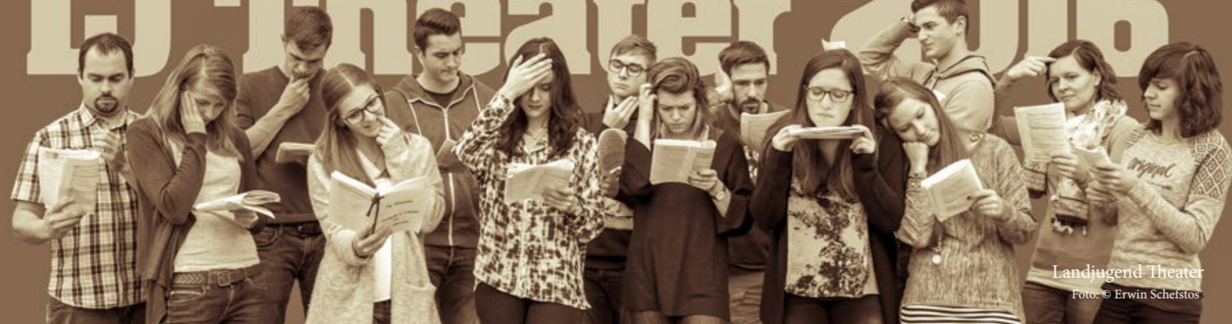
Landjugend Theater