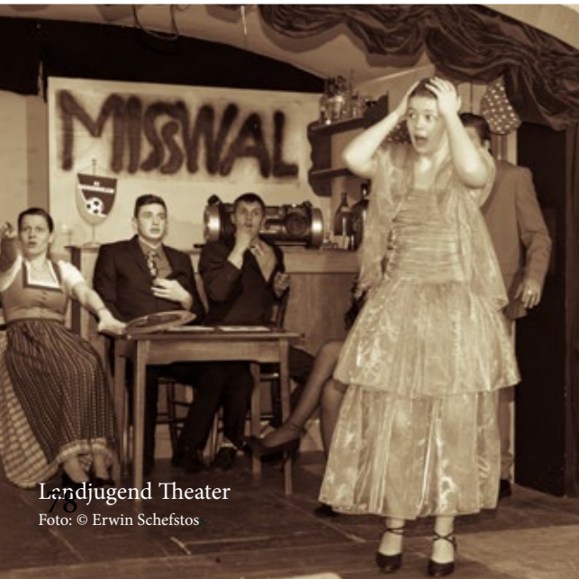
Landjugend Theater