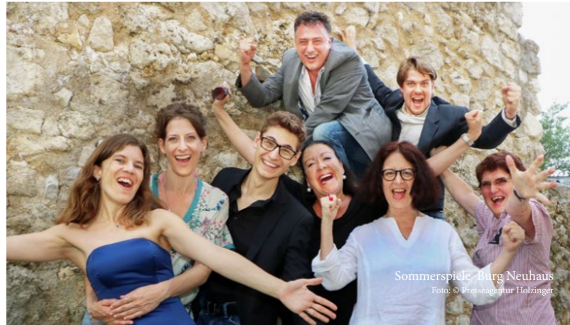
Sommerspiele Burg Neuhaus

www.sommertheater-hafnerberg.at www.burg-neuhaus.at